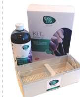
Ref OL22215 KIT